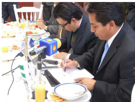
Convenio con Jesús María