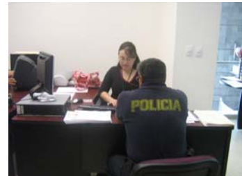
Un policía poniendo una queja ante CEDH.

Tras la intervención de la Policía Federal Preventiva y de elementos del Ejército Mexicano a la Secretaría de Seguridad Pública Municipal, un grupo de 16 policías municipales interpusieron queja por presunta violación a sus derechos humanos contra la corporación policíaca federal, quejas que fueron recibidas por esta Comisión y remitidas a la CNDH por ser de competencia nacional.