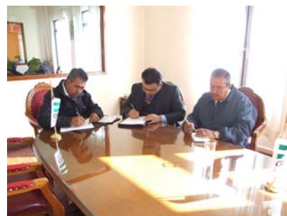
Convenio con Rincón de Romos