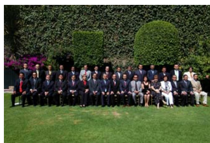
Fotografía oficial del XXX Congreso de la FMOPDH

Por espacio de tres días, presidentes de las comisiones de derechos de todo el país disertaron sobre una agenda específica de la cual emanó la Declaración de Aguascalientes.