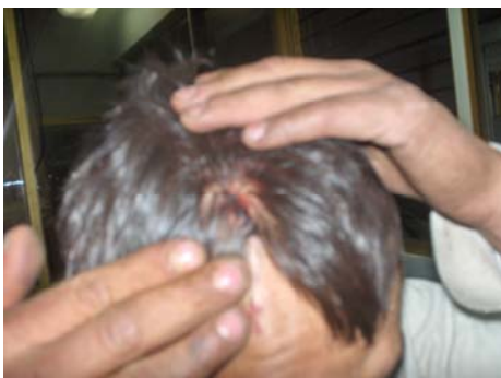
Aspectos de un ciudadano agredido por policías.

Su poder es mucho más efectivo debido a la fuerza moral que ejerce la opinión pública y política de la sociedad. En el periodo diciembre del 2007 a noviembre del 2008 el organismo emitió un total de 18 recomendaciones dirigidas a diversas instancias estatales y municipales por violaciones a los derechos humanos. Cabe destacar que en el mismo periodo, el organismo protector de los derechos humanos emitió 15 acuerdos de no responsabilidad de funcionarios a los que se les acusó de violación a derechos humanos sin que se acreditaran.