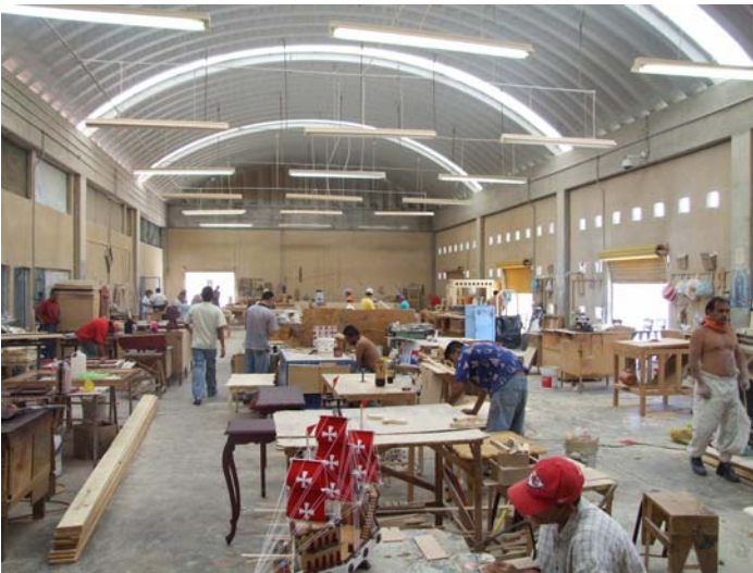
Aspecto de un taller de actividades económicas dentro de un Cereso.

El método y los mecanismos para medir la afinidad del sistema de readaptación social en los estados, obligan a estas Instituciones a buscar un modelo que permita su evaluación en forma cualitativa y cuantitativa.