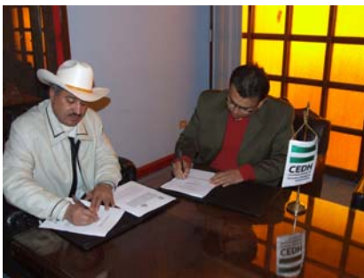
Convenio con Asientos