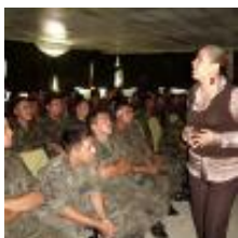
Actualización de militares.

Especial mención obedece los trabajos de actualización y capacitación a elementos del Ejército Mexicano destacamentados en la 14/va Zona Militar en el estado.