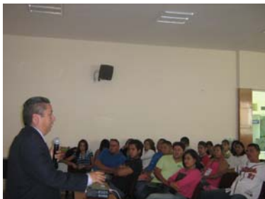
Capacitación a operadores jurídicos.

Con el apoyo de la CEDH, la Universidad de la Concordia realizó un interesante Congreso de Derecho en el que participaron 300 estudiantes y profesionales del derecho de esta entidad.