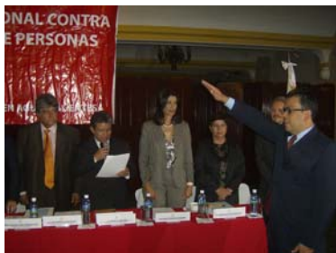
Rinde protesta el Ombudsman como secretario Técnico del comité regional.