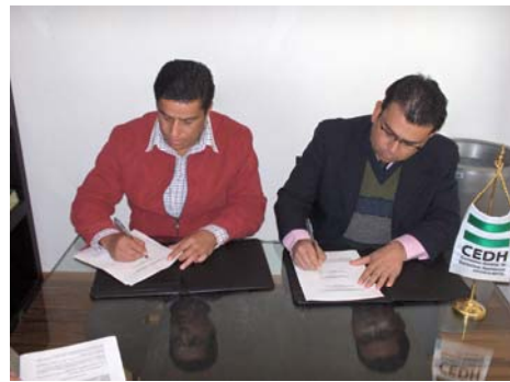
Convenio con Cosió