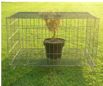
Prisión y dignidad.

La Comisión Estatal de los Derechos Humanos, preocupada por el respeto de los Derechos Humanos en el Sistema Penitenciario del estado de Aguascalientes, realizó un estudio sobre la prisión preventiva. Se hicieron una serie de encuestas en los centros de reeducación social para varones Aguascalientes, de reeducación social para mujeres y en el estatal de desarrollo para el adolescente, orientadas a reflejar a realidad que prevalece en dichos centros respecto del encarcelamiento de las personas durante el proceso penal en el que se determinará si son responsables o inocentes de la conducta que se le imputa.