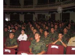
Militares en actualización.

nacional, como el Doctor Víctor Martínez Bulle Goyri y personal de capacitación de la Comisión Nacional de derechos Humanos, quienes junto con los especialistas en el tema de derechos humanos de la propia Comisión, desarrollaron este interesante programa de capacitación a funcionarios públicos.