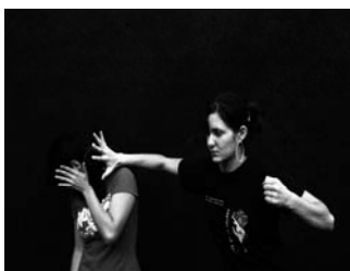
Por la eliminación de la violencia.