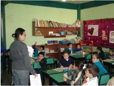
Programa Niños Promotores.

El objetivo general de este programa es la difusión de los derechos de las niñas y los niños en condición escolar que viven en Aguascalientes, para ir conformando una sociedad no violenta, sensible y respetuosa del interés superior de la niñez.