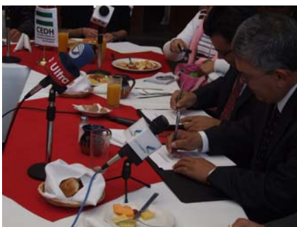
Convenio con Calvillo