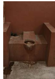
El reto: mejorar los centros de detención municipales