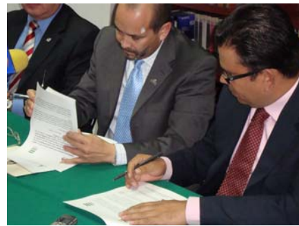
Firma de convenio con el ITEA.

Así, producto de esta estrategia de vinculación con la sociedad civil organizada y con autoridades fueron firmados un total de 16 convenios de colaboración destacando los signados con las 11 presidencias municipales y con la empresa concesionaria del servicio del agua CAASA, mediante el cual se pudo potenciar las acciones de difusión, como la impresión de 230 mil folletos difundiendo los servicios de la comisión que fueron distribuidos a través de los recibos de facturación. De forma adicional, cuando la CEDH cambió el domicilio de sus oficinas centrales a República de Perú 205, CAASA difundió por dos meses consecutivos la nueva dirección y teléfonos en los recibos del agua.