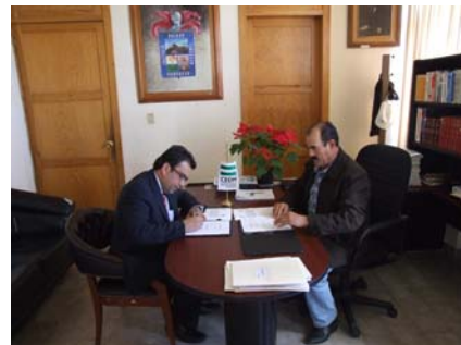
Convenio con Tepezalá