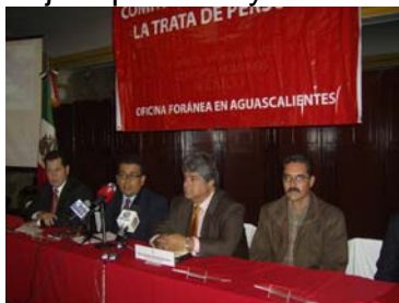
Primera sesión del comité regional.

Nutrida resultó ser la primera sesión de trabajo de este comité que tiene por objeto prevenir y combatir la trata de personas.