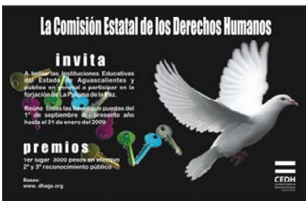
Cartel promocional del monumento a la paz.

Aguascalientes, se ha caracterizado su vocación de paz social y laboriosidad, nada menos en su escudo se acuña que somos la tierra de la gente buena, o recordar que fue justo aquí en donde se efectuó la Soberana Convención Revolucionaria, hecho que simboliza por sí misma la paz.