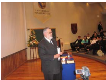
Aspectos de la conferencia en la Universidad Panamericana.

este nuevo esquema de justicia, omitió la consulta de los involucrados para enriquecer este proceso de cambio y a que en las universidades, los planes de estudio no contemplan este nuevo procedimiento procesal, lo que advierte serios retos, ello sin considerar las enormes inversiones que se tendrán que hacer para adecuar el actual sistema de justicia con el oral, entre otros tópicos.