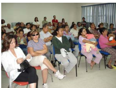
Aspectos de un curso de capacitación Sobre derechos humanos a mujeres.

Dentro de los esfuerzos por propagar la cultura de los derechos humanos entre la sociedad en general, la Comisión dispuso de un amplio catálogo de conferencias que se ofrecieron de forma gratuita a quienes así lo solicitaron incluyendo actividades que formaron parte para el cumplimiento de convenios y acuerdos de colaboración con diversas instituciones. Así, la comisión ofreció este año 22 cursos distintos, todos ellos relativos a la temática de derechos humanos.