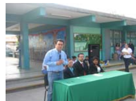
Inauguración del curso de verano.

Este curso de verano estuvo dirigido a niñas y niños de la Colonia Constitución, llevándose todas las actividades en la escuela secundaria técnica número 17, al norte de la ciudad. En este curso les fueron impartidos conocimientos relativos a los derechos humanos de los niños y la forma