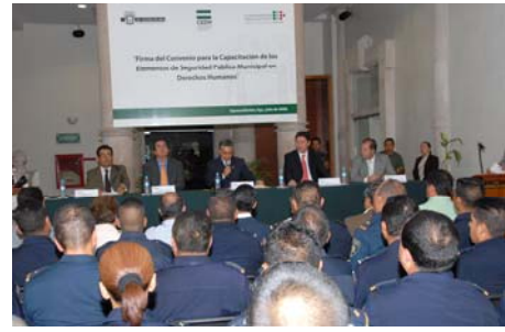
Aspectos de la firma de convenio con la presidencia municipal de Aguascalientes.