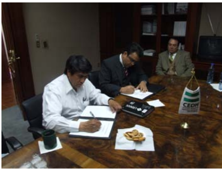
Convenio con Asientos