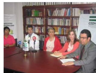
Conferencia de prensa con directivos del Centro de Estudios Diferenciados A. C.

Con el apoyo de la Comisión Estatal de Derechos Humanos, el Centro de Estudios Diferenciados A. C. llevó a cabo una interesante conferencia en la que se abordó el tema del Déficit de Atención con y sin hiperactividad y se expuso que este padecimiento no es atendido adecuadamente por las autoridades de salud y educación toda vez que es causa de discriminación. Los mal llamados “niños problema” son rechazados desde sus hogares y en la escuela, menguando sus posibilidades de atención digna.