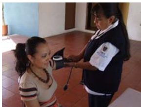
Atención médica a una ciudadana.

La jornada efectuada en el municipio de Rincón de Romos, ésta se llevó a cabo los días 1,2 y 3 de abril contando en esta ocasión con la altruista participación de las siguientes ong's: Colectivo Sergay de Aguascalientes, A.C. Colegio de Trabajadores Sociales de Aguascalientes, A.C. Fundación Ahora, A.C. Fundación Amigos para Siempre, I.A.P. Fundación del Dr. Simi, A.C. Grupo Metztlí, A.C. Instituto de Técnicas para la Salud Integral, A.C. Juntos en el Camino de la Diversidad, A.C. y Mujer contemporánea, A.C.