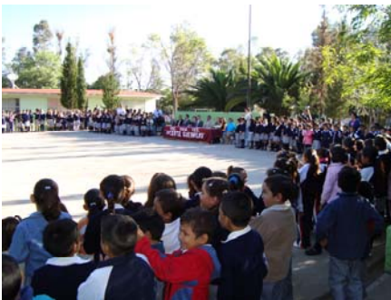
Inicio de las jornadas en Loma Bonita

También se efectuó una jornada en la colonia Loma Bonita realizada los días 21,22 y 23 de octubre en la que también se tuvo la participación de las ONGs: Abuelos Productivos, A.C. Asociación de Lucha contra el Cáncer de Aguascalientes, A.C. Colectivo Sergay de Aguascalientes, A.C. Colegio de Trabajadores Sociales, A.C. Mujer Contemporánea, A.C. Fundación Ahora, A.C. Fundación del Dr. Simi,