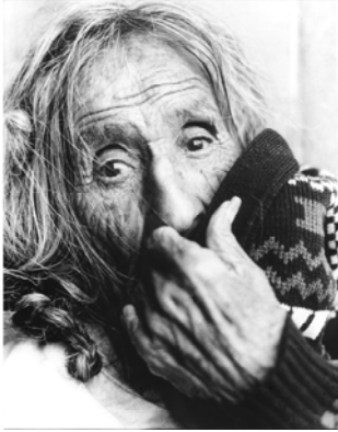
Por las personas de la tercera edad.