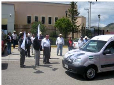
Arranque del “derechomóvil” en Asientos

Arrancaron los trabajos de la Visitaduría Itinerante en el municipio de Asientos en donde el “derechomóvil” realizó un amplio recorrido por las diversas comunidades durante por espacio de 6 semanas.