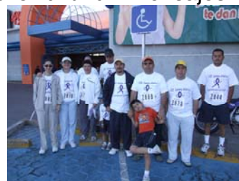
El Obudsman y trabajadores de la CEDH en la carrera

Tal fue el caso de la carrera atlética de Radio Universal en donde de forma conjunta con ONG`s efectuaron esta competencia a la que fue invitada la CEDH en su calidad de promotora de los derechos a la salud. Así, el personal del organismo tomó parte en esta competencia.