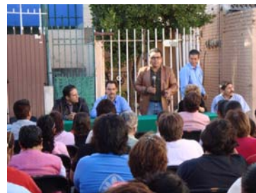
Jornada Médica en Las Viñas.

El esquema resulta de gran utilidad porque permite que ciudadanas y ciudadanos accedan a esquemas de salud, medicamentos gratuitos así como a talleres y charlas de superación personal y desde luego, se les informa sobre sus derechos fundamentales.