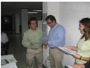
Entrega de diplomas a trabajadores de la CEDH.

Personal del Instituto del Medio Ambiente del estado impartieron un curso de capacitación de 12 horas a trabajadores de la CEDH como parte del programa de formación y actualización. En este curso se vio la importancia del respeto a los derechos ambientales iniciando así una gestión eficiente para el aprovechamiento de los recursos de la CEDH.