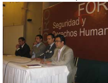
El Ombudsman durante su participación en el foro de seguridad y derechos humanos.

Omar Williams López Ovalle tomó parte activa en este foro en el que fueron expuestas diversas propuestas sobre cómo enfrentar la inseguridad. En su participación, el Ombudsman hizo un llamado a las autoridades a reforzar aquellos esquemas exitosos y reemplazar técnicas y estrategias que han probado su ineficacia. Propuso además la creación de un observatorio de seguridad pública que analice con transparencia y objetividad el fenómeno.