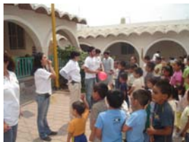
Festividades del Día del Niño.

La CEDH celebró el Día del Niño compartiendo alegría a los menores con actividades recreativas y educativas en materia de derechos de los niños y las niñas. Para ello se realizaron dos visitas, una al Hogar de la Niña y otro más a la Ciudad de los Niños.