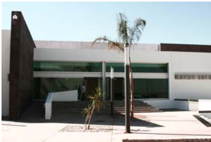
Aspectos de un edificio de seguridad pública

Durante diciembre del 2007 a noviembre del 2008, el total de denuncias recibidas en esta Comisión por parte de ciudadanos que sintieron vulnerados sus derechos humanos fueron 295 de las cuales, 145 fueron contra la Secretaría de Seguridad Pública Municipal, seguida de los Centros de Reeducción