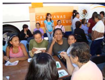
Jornada Médica en la colonia del Trabajo.

Antes de concluir el mes, se efectuó una segunda jornada realizándose en la Colonia del Trabajo. Los habitantes de esa colonia participaron muy entusiastamente en cursos de bisutería y en corte de pelo, además del esquema de atención de salud de primer nivel.