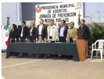
Inauguración de las Jornadas en Asientos

De forma exitosa se han estado desarrollando las Jornadas Médicas por los Derechos Humanos, y tocó el turno ahora al municipio de Asientos en donde fueron atendidos habitantes de zonas marginadas de aquella región, en el esquema de los proyectos especiales de atención de parte de la Comisión Estatal de derechos Humanos en conjunto con otros organismos e instituciones