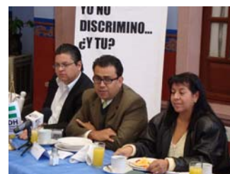
Día Mundial de lucha contra el VIH-SIDA