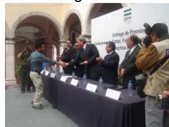
Aspectos de la entrega de premios.

En la edición 2007 de estos concursos fueron registrados un total de 43 trabajos de cartel y fotografía y cinco de ensayo literario, teniendo como respaldo a instituciones como la Universidad Autónoma de Aguascalientes,