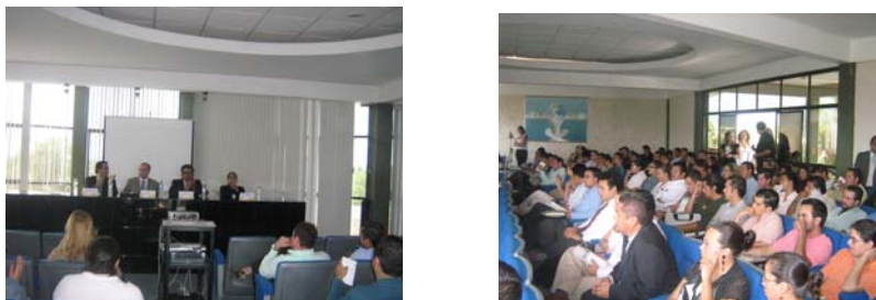
Aspectos de la conferencia dictada en la Universidad Cuahutémoc.

Como parte de las actividades académicas conjuntas efectuadas por la Universidad Cuahutémoc y la Comisión Estatal de Derechos Humanos, dentro del programa para la formación de operadores jurídicos, el constitucionalista Miguel Carbonell impartió la interesante conferencia magistral denominada “La Reforma Penal” en la que participaron cerca de 100 alumnos de la carrera de derecho de esa casa de estudios así como abogados.