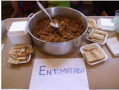
Saludable y a bajo costo se dan en las jornadas por los Derechos Humanos.

Los días 26, 27 y 28 de febrero se llevó a cabo la Jornada Médica por los Derechos Humanos en el municipio de Asientos teniendo como participantes en la realización de estas jornadas a las ONG's: Colectivo Sergay de Aguascalientes, A.C., Fundación Amigos para Siempre, I.A.P., Fundación del Dr. Simi, A.C. Grupo de Enfermos con Problemas Renales, A.C. Grupo Metztlí, A.C. Instituto de Técnicas para la Salud Integral, A.C. Mujer Contemporánea, A.C. Nueva Vida 5 Fuentes, A.C.