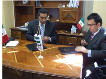
Con San Francisco de los Romo