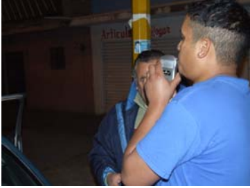
Ciudadano haciendo la prueba del alcoholímetro.

Hasta el mes de noviembre, el organismo protector de los derechos humanos participó en un total de 1763 aplicaciones, dando como resultado 246 casos positivo al estado de ebriedad, 634 con aliento alcohólico.