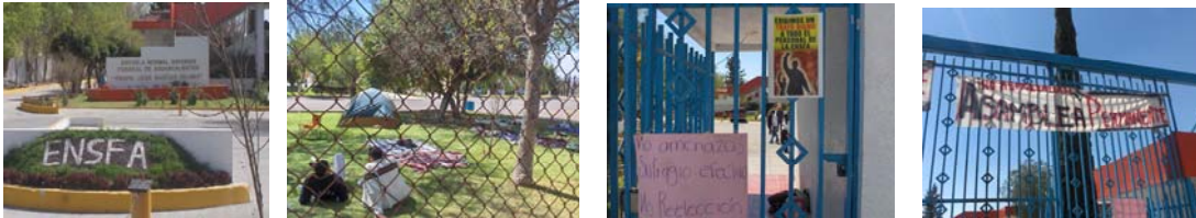
Aspectos del conflicto surgido en el mes de febrero entre alumnos y autoridades educativas de la Escuela Normal Superior Federal de Aguascalientes en donde mediadores de la Comisión contribuyeron al diálogo.

Cabe subrayar que la mediación la emplea la comisión solo en aquellos casos en que las arbitrariedades no son graves y en los que la conciliación se presenta como la opción más adecuada para solucionar el problema que plantea el ciudadano.