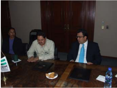
Convenio con El Llano