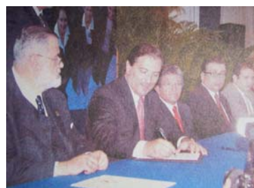
Firma de convenio CNDH- CEDH y Gobierno del Estado.

Los objetivos centrales de los acuerdos establecidos, son compartir espacios comunes para la investigación académica a fin de proponer líneas de acción para la consolidación de la cultura de los derechos humanos en el Estado, así como promover, coordinar y ejecutar actividades de capacitación y formación en ese ámbito, dirigidas a servidores públicos.