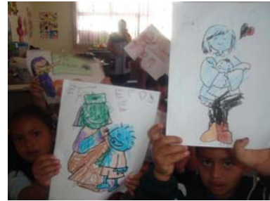
Las niñas y los niños saben sus derechos.

Por lo que respecta a este programa, fueron capacitados un total de 8 mil 211 menores de educación primaria, de los cuales 3 mil 918 fueron niñas y 4 mil 293 niños.