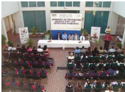
Arranque de las jornadas en Pabellón de Arteaga.

En el Municipio de Pabellón de Arteaga fueron realizadas las séptimas jornadas médicas por los derechos humanos organizadas por la CEDH con la participación de diversas ONG's y dependencias federales, estatales y municipales.