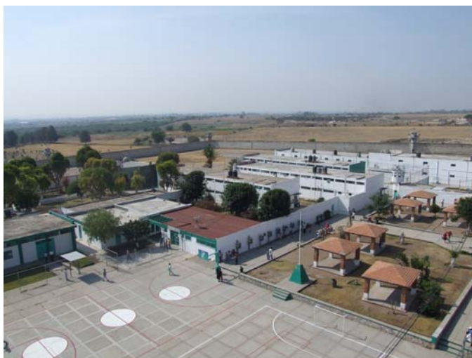
Vista aérea de un centro de reeducación social.

Así, el cereso Aguascalientes obtuvo una calificación de 6.31, que contrasta con el 5.68 obtenida en el 2007. El cereso de El Llano obtuvo un 7.09 contra el 6.39 registrado el año pasado mientras que el cereso femenino alcanzó el 7.60 contra el 7.00 registrado un año antes. Estos resultados indican que el sistema penitenciario estatal logró avanzar en términos de mejoras las condiciones de dignidad y de respeto a los derechos humanos de las personas en reclusión.