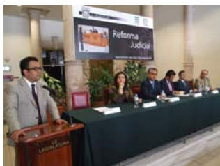
El Ombudsman durante su participación en el inicio de la conferencia magistral.

Invitado por la CEDH, el diputado federal César Camacho Quiroz, Presidente de la Comisión de Justicia, impartió en el vestíbulo del palacio legislativo una conferencia magistral denominada “La Reforma Judicial en México” en donde explicó la esencia y razón de la reciente reforma judicial en el país.