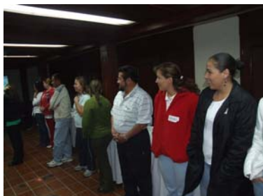
Capacitación al personal de la CEDH.

Entre las actividades de capacitación al personal de la Comisión destacó el curso impartido por especialistas en el tema de los derechos humanos e integración de grupos de trabajo de la Comisión Estatal de Derechos Humanos de Jalisco, quienes impartieron un taller de 10 horas. En este taller se abordaron aspectos de la conformación de equipos de trabajo en tareas de ayuda social y de protección de derechos humanos a grupos vulnerables.