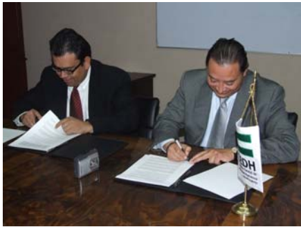
Firma de convenio con CAASA.

En el periodo que comprende el presente informe, la Comisión Estatal de Derechos Humanos fortaleció la estrategia de interrelación institucional con diversos organismos, a través de la firma de convenios de colaboración institucional que dieron el sustento para la realización de las actividades aquí señaladas, destacando el trabajo conjunto con diversas organizaciones de la sociedad civil, así como de autoridades municipales y de algunas empresas privadas.